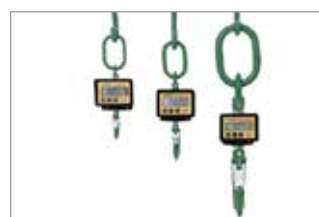
EQUIPOS DE PESAJE DE CARGA