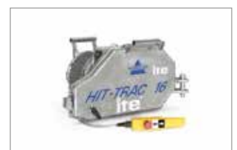
TRACCIÓN POR CABLE